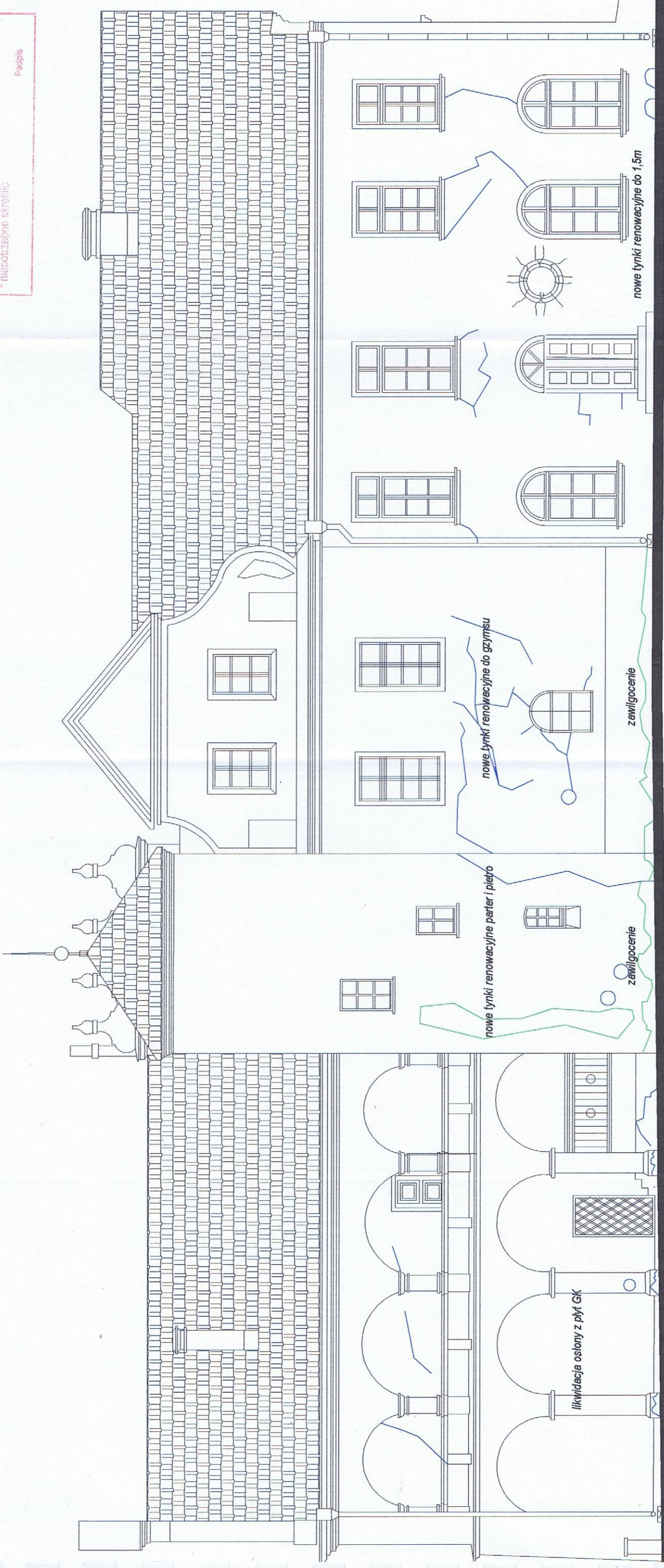
izolacja pionowa murów fundamentowych na gł. 2,0m

Opis: Wojewódzki Konserwator Zabytków "Antykwariat" - Rayfame jako zaręczanie do przedsięwzięcia "Antykwariat" projekt budowlany - AN. 5.142. 7.10.10.17.10 znak sprawy: AN. 5.142. 7.10.10.17.10 Opole, dnia ..... * nieodpłatnie skreślić Podpis